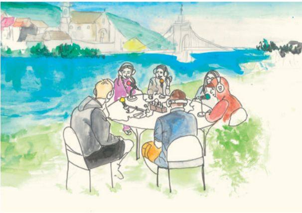
Dessin - Amandine Deguilhem

L'Observatoire phoNographique sensible du Rhône s'inscrit dans le cadre du volet Éducation au territoire du Plan Rhône-Saône