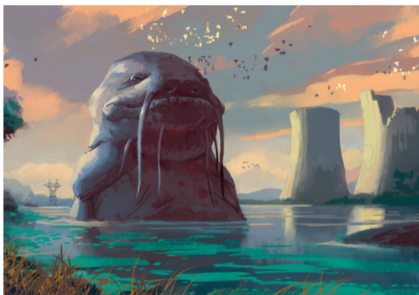
Visuel - Albyon